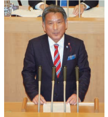
本会議にて代表質問